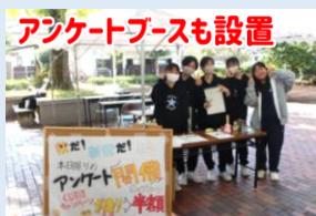
アンケートブースも設置