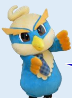
ありあけ新世マスコット キャラクターしんぼち

多くの方にお越しいただき、ありがとうございました! 次回開催時期は未定ですが、ぜひお越しください!