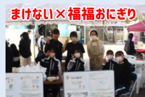
まけない×福福おにぎり