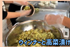
ウイナーと高菜漬け