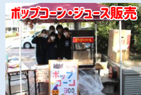
ポップコーン・ジュース販売