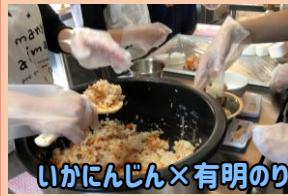
いかにんじん×有明のり