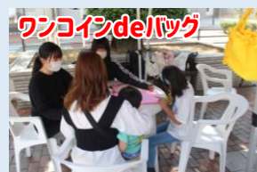
ワンコインdeバッグ

今回のマルシェは、前回よりさらに大きく盛り上がりました。売れ残りゼロを目標に みんなが必死になっている姿を見て、とても嬉しく思いました。そして完売を達成 できたことが何よりも嬉しかったです。楽しくみんなで取り組めたので良かったです。