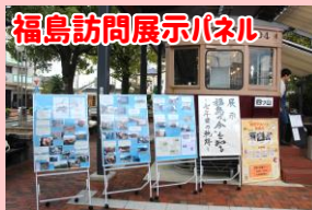
福島訪問展示パネル