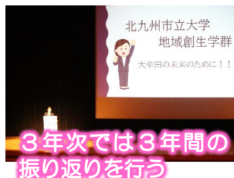
3年次では3年間の振り返りを行う