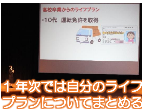
1年次では自分のライフプランについてまとめる