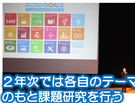
2年次では各自のテーマのもと課題研究を行う