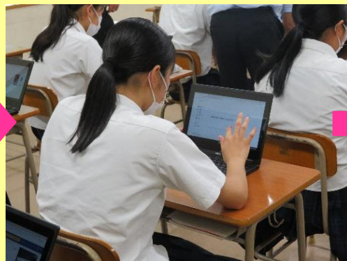
各自で Quizlet に取り組み、理解度をチェックする