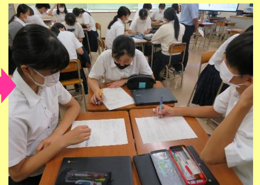
学習内容を班でまとめ、次回の授業で深い学びへとつなげる