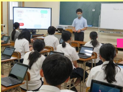
前時の授業の振り返りを行い、興味関心を高める

★ 本校でのICTの効果的な活用：Quizlet (クイズレット) を使った学習 少人数クラス(21名)の地学基礎の授業で、一人一台Chromebook ★