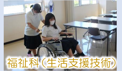
福祉科 (生活支援技術)