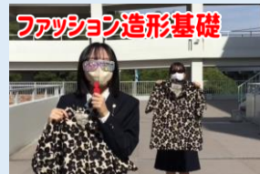
ファッション造形基礎

「簿記(商業)」の授業では、お金の流れなど学んで、簿記検定などの検定試験合格を目指しているんだよ!