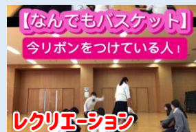
「なんでもバスケット」