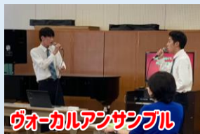
ヴォーカルアンサンブル