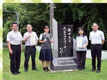
総合部(ライフル射撃競技)