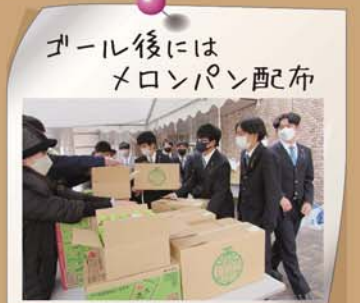
ゴール後には メロンパン配布