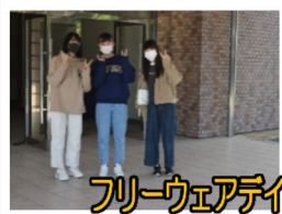
フリーウェアデイ