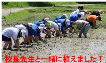
校長先生と一緒に植えました！